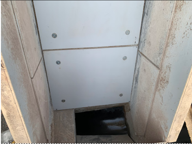
ライナー取り付け