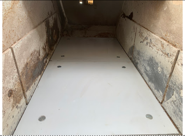
ライナー取り付け