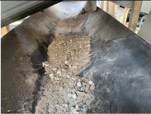
ベルト上 片付け前