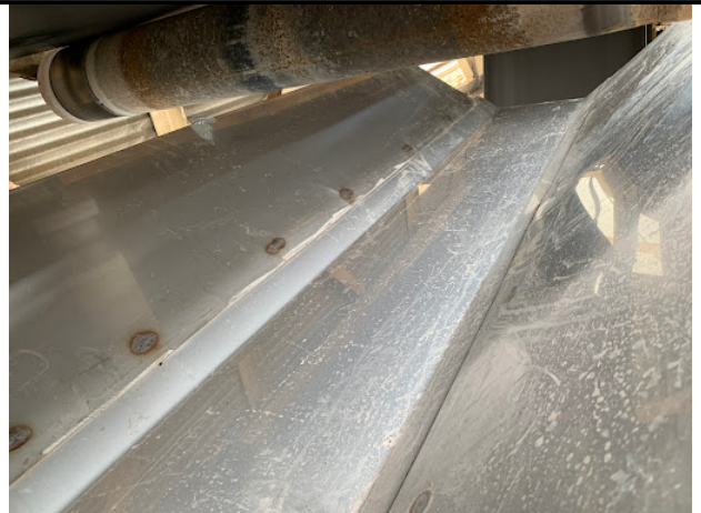
ウェイトボックス手前（ベントプリー）まで落下防止板を交換