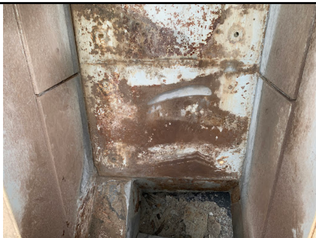
ライナー取り外し後