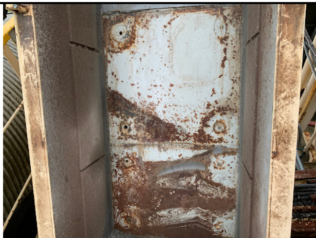
ライナー取り外し後