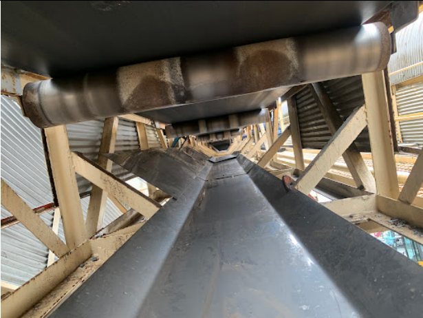
新しい板を入れ込み中