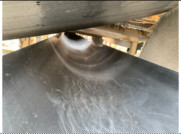
ベルト上 片付け後