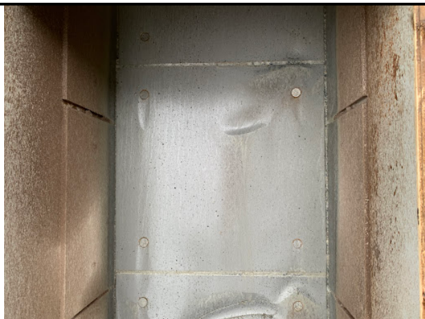
ライナー取り外し前