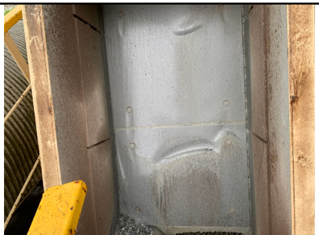
ライナー取り外し前