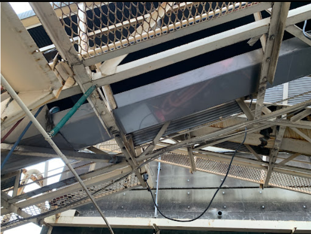
仮止め溶接していたものを、全てタップでホン溶接にて処理