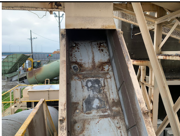
取り付け前 清掃後