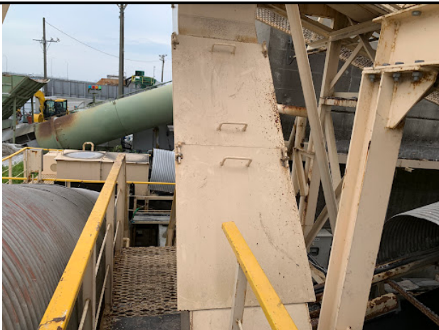
蓋を閉めて作業終了